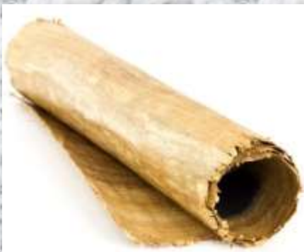
Rollo de Papiro

Así que el término válido, cierto y correcto que debe usarse es Sagradas Escrituras, que es uno de los términos que efectivamente si aparece utilizado, no como la palabra “biblia” que no aparece en ninguno de sus libros, y nunca ni los hijos de Israel ni los creyentes antiguos la conocieron por ese nombre. 2 Timoteo 2/14-16: “Pero persiste tú en lo que has aprendido y te persuadiste, sabiendo de quién has aprendido; y que desde la niñez has sabido las Sagradas Escrituras, las cuales te pueden hacer sabio para la salvación por la fe que es en el Mesías Jesús. Toda la Escritura es inspirada por Dios, y útil para enseñar, para redargüir, para corregir, para instruir en justicia, a fin de que el hombre de Dios sea perfecto, enteramente preparado para toda buena obra.”