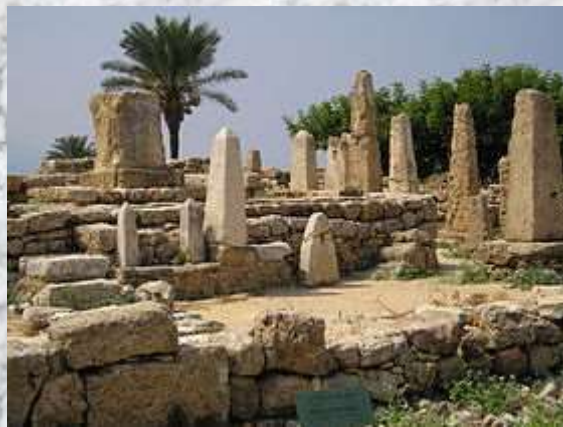
Ruinas del Antiguo Puerto de Biblos

La palabra “biblia” proviene de la palabra latinizada “biblia”, que viene a su vez de la palabra griega “ biblion ”, que se traduce como libro, cuyo plural era “biblia” traducido como libros. Y los griegos a su vez tomaron la palabra “ biblion ” de un famoso puerto fenicio de la antigüedad conocido como Biblos, ya que desde ese puerto se comercializaba el papiro traído de Egipto, material este con el que se hacían los rollos o libros en los cuales se escribía en la antigüedad y con ese nombre de “biblos” se identificó en el transcurso del tiempo a esos rollos de papiro egipcio.